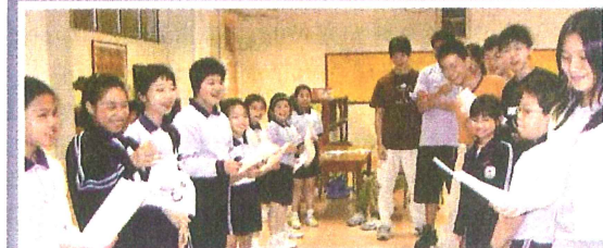
香港南區扶輪社主辦的英語對話小組，讓來自德瑞國際學校的扶輪少年服務團，教導鴨脷洲街坊會學校學生學習英語。