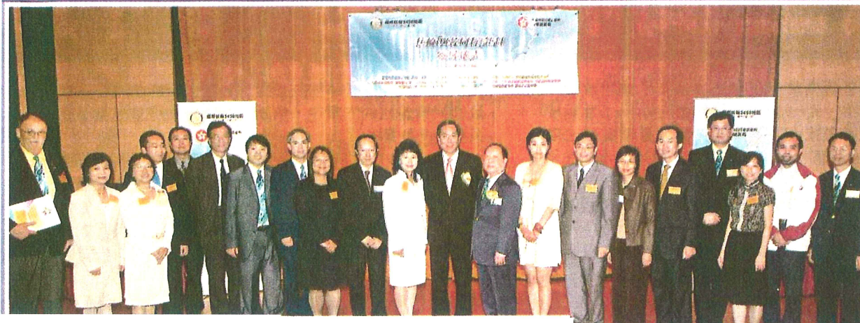
各扶輪社與學校於去年10月簽約結成合作夥伴，參與「扶輪與校同行」計劃，而教統局局長李國章(右10)當日亦出席支持。