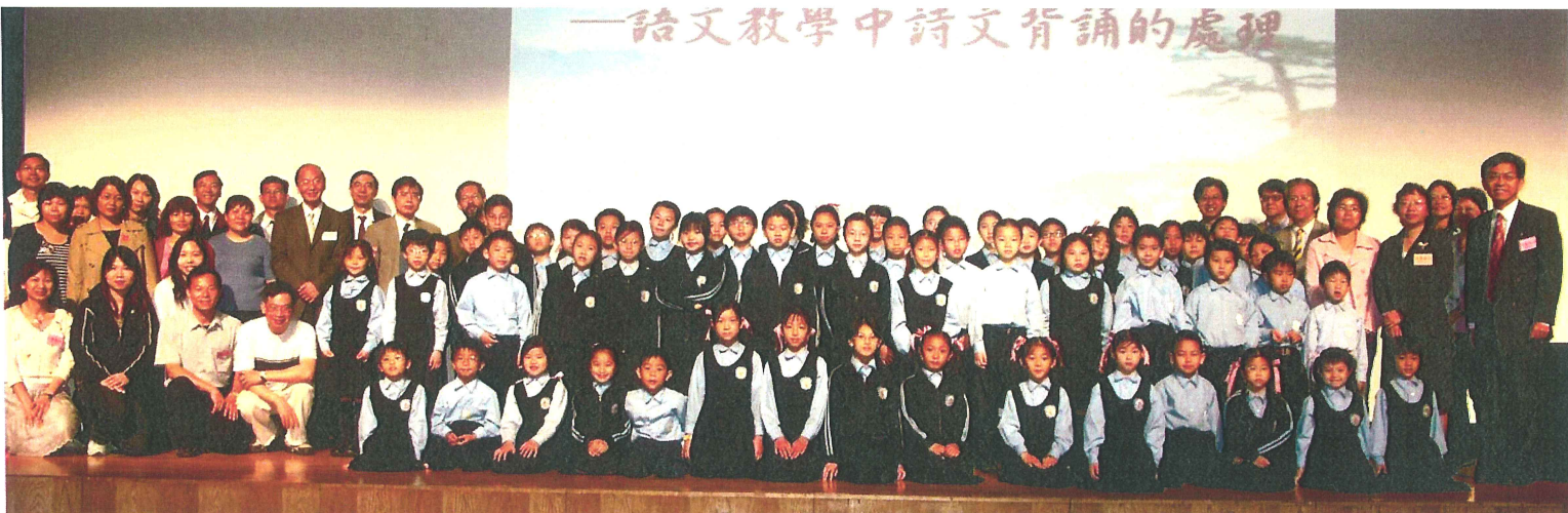
—語文教學中詩文背誦的處理